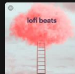
lofi beats Let yourself be sunkissed with beats ...