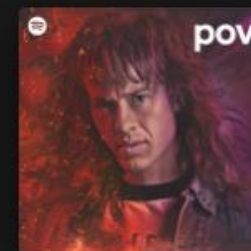
pov CHRISSEY WAKE UP, I DON'T LIKE THIS