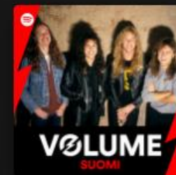
VOLUME SUOMI Suomen suurin ja paras rock-soittolista....