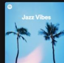
Jazz Vibes The original chill instrumental beats...