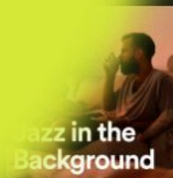
Jazz in the Backgr... Soft Jazz for all your activities.